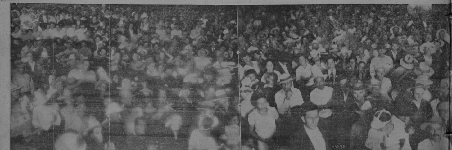
Mientras el cortésimo para poder ponerle auditorio a su candidato Cortés, se vió precisado a correr extraordinariamente ciento cinco camiones, el Bechismo celebraba antenoche en Alajuela a la parca del candidato del despartido y del miembro, ya que toda esa gente, como ejército valeroso y viril está dispuesta junto con la del resto de los