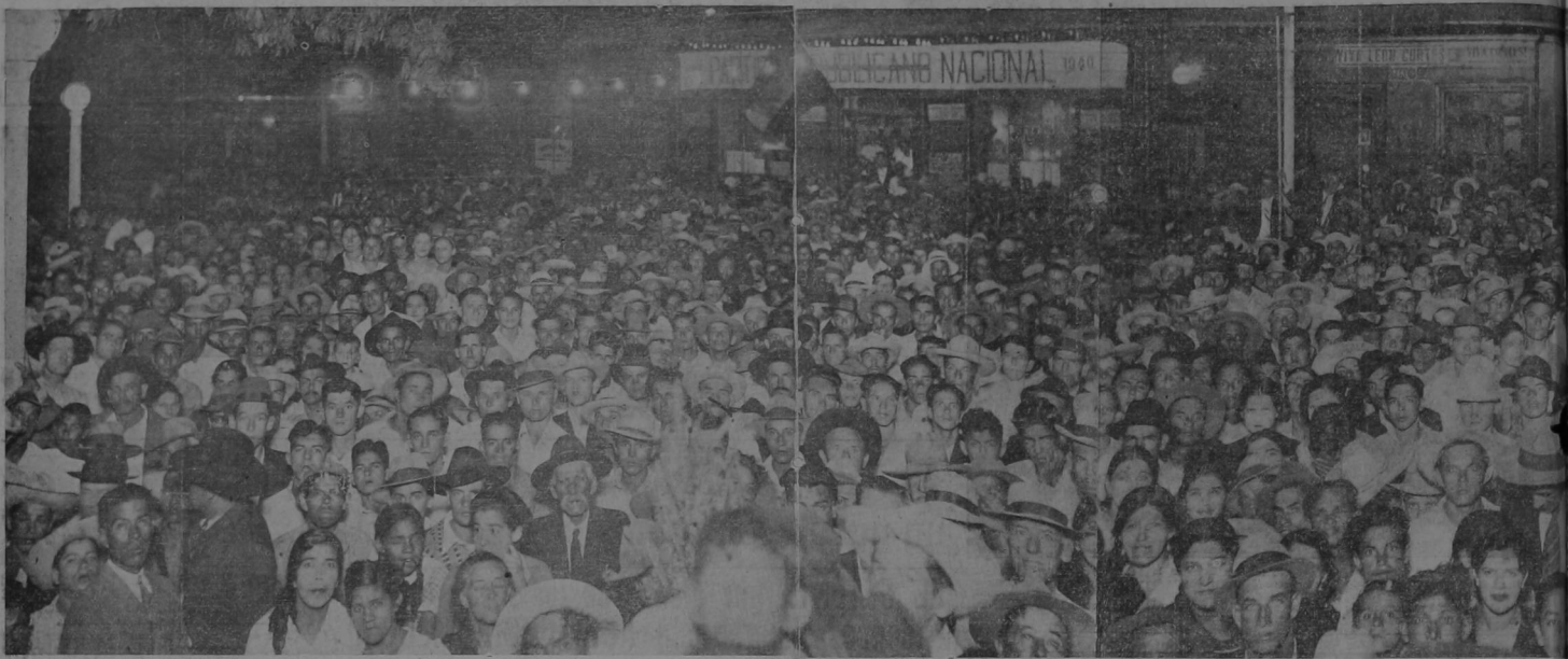
Parte de la inmensa muchedumbre que asistió a la Gigantesca reunión cortesista del lunes en Alajuela. Jamás se vió en la histórica ciudad del Erizo una asamblea política más imponente ni más concurrida y obsérvese como aquí el fondo de los edificios sirve de garantía de la autenticidad de nuestra fotografía, mientras en la fotografía bechi-comunista ni empalma ninguna figura y puede verse claramente el pueblo Alajuelense aclamando al futuro